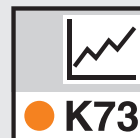
Einblenden der grafischen Darstellung der Einnahmen- und Ausgaben-Entwicklung über den Betrachtungszeitraum während der Bearbeitung.

Programm zur Berechnung der Wirtschaftlichkeit von Gebäuden oder gebäude-technischen Anlagen nach VDI 2067 und weitergehenden betriebswirtschaftlichen Berechnungen nach VDI 6025